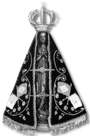
Nossa Senhora Aparecida, rogai por nós!