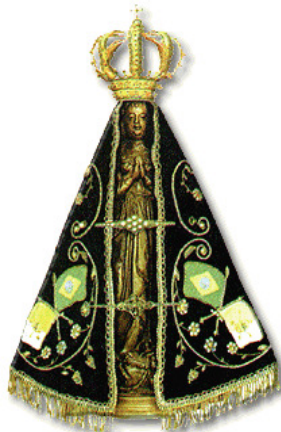
Nossa Senhora Aparecida, rogai por nós!