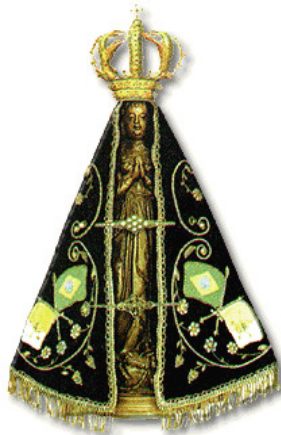
Nossa Senhora Aparecida, rogai por nós!